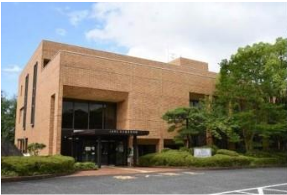
三木市 みき歴史資料館