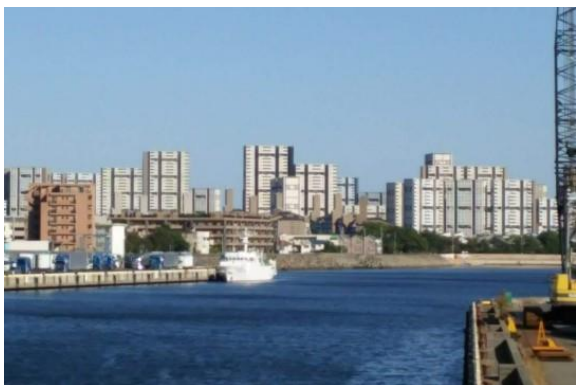
芦屋市 シーサイドタウン