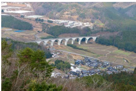
朝来市 竹田城跡からの眺め